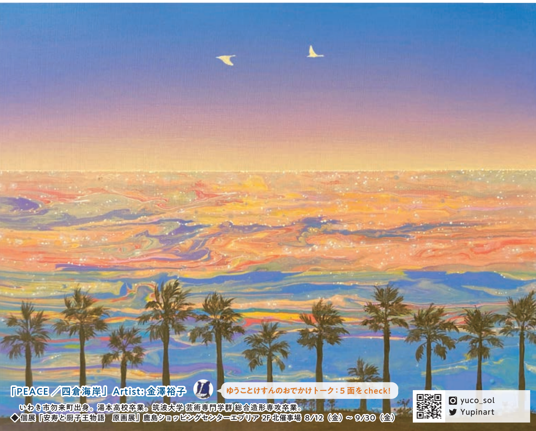
「PEACE / 四倉海岸」Artist: 金澤裕子