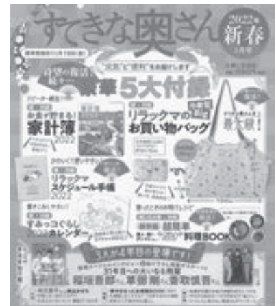
プレゼントはこちら

今月のクイズはクロスワードパズルです。お楽しみください。そして、正解者の中から3人に、いわき民報社提供の『すてきな奥さん 2022年新春1月号』（税込み1760円）を1冊プレゼントします。2022年の家計簿やリラックマのスケジュール手帳、買い物バッグ、すみっこぐらしのカレンダー、超簡単料理BOOKが付録としてついています。