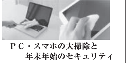
PC・スマホの大掃除と 年末年始のセキュリティ

PCの中も、OSとよく使用するソフトを最新の状態にアップデートし、使っていないソフトは完全に削除して整理整頓を。Windowsでは無駄なファイルや削除する「ディスククリーンアップ」という機能もあります。古いバージョンのOSやソフトは、ウイルスや悪意あるプログラムの標的になります。OSや各種ソフトを最新バージョンにし、不要なソフトを削除すると「セキュリティ強化、空き容量