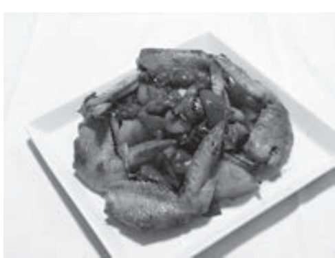
レモンで爽やかに！

に野菜をのせ、その上手に手羽先を添える。 ◆材料(2人分) 手羽先6本、ニンジン、玉ネギ各80g、ジャガ芋100g、ピーマン2個、パプリカの赤と黄各30g、ブロッコリー60g、マイタケ、うゆ、塩、コシユウ各シメツ各30g、長ネギ少量。 の青い部分30g、揚げ油適量。調味料Aレモン果汁大さじ2、塩小さじ1、コシユウ少量。調味料B黒酢大さじ2、酢大さじ1、砂糖大さじ2、ごま油小さじ2分の1、しょうゆ、塩、コシユウ各少量。