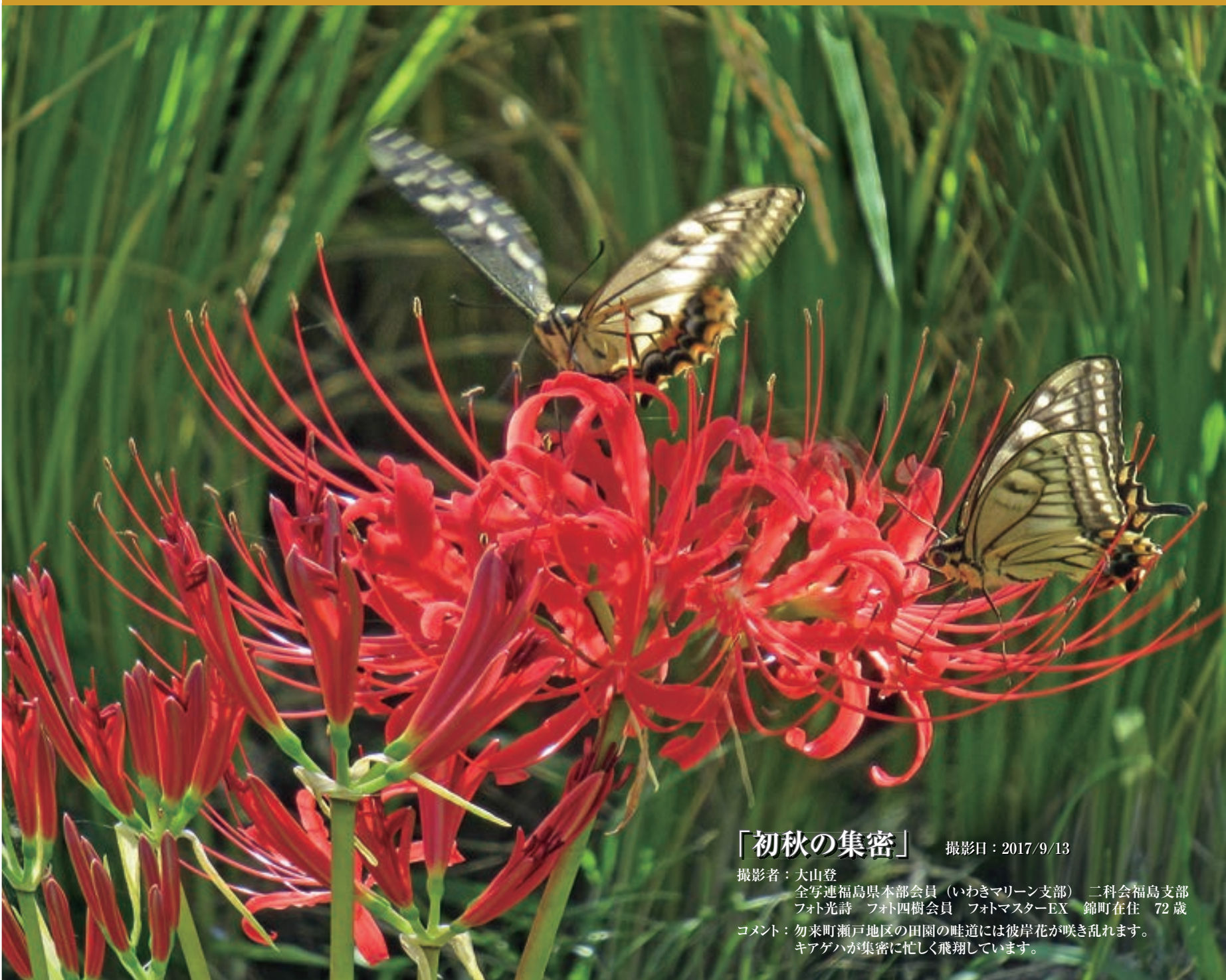
「初秋の集密」 撮影日：2017/9/13

撮影者：大山登 全写真福島県本部会員（いわきマリン支部） 二科会福島支部 フォト光詩 フォト四樹会員 フォトマスターEX 錦町在住 72歳 コメント：勿来町瀬戸地区の田圃の畦道には彼岸花が咲き乱れます。 キアゲハが集密に忙しく飛翔しています。