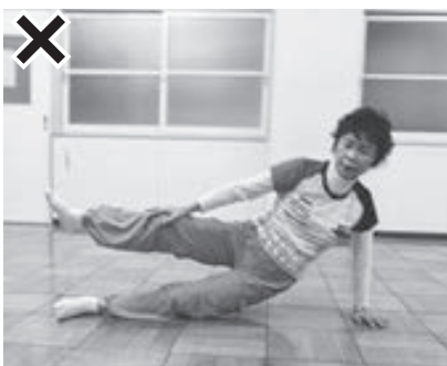
(写真3) お尻が落ちている。中心軸が湾曲している