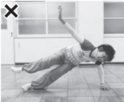
(写真4) 体が前に傾いてバランスが崩れている