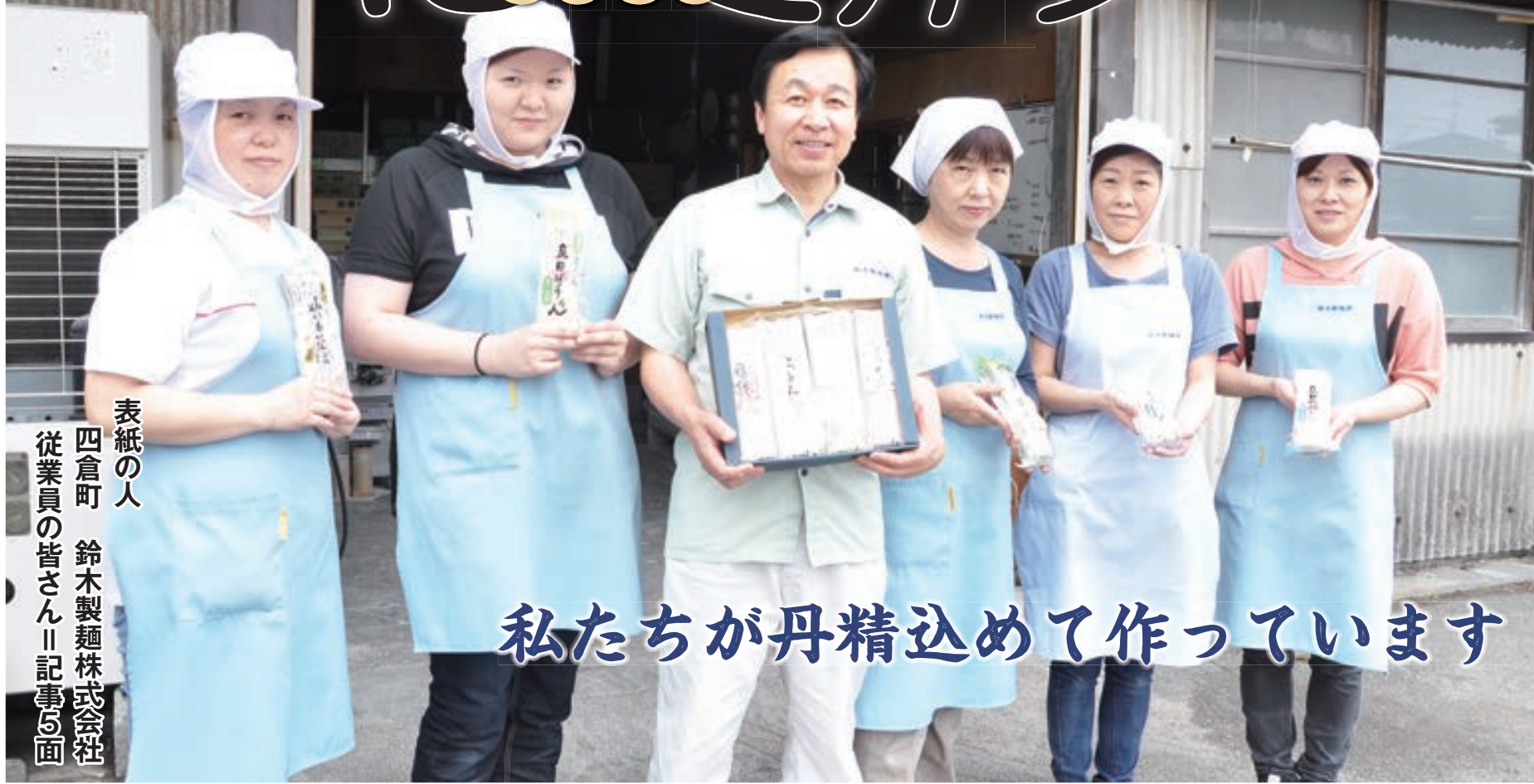
表紙の人 四倉町 鈴木製麺株式会社 従業員の皆さん 記事の面