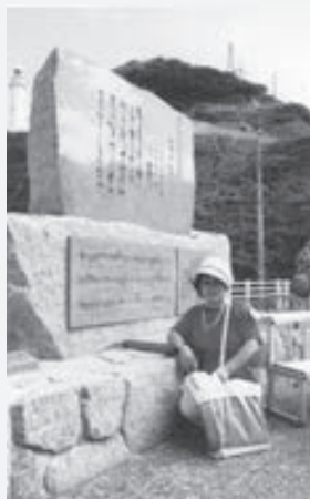
「みだれ髪」の歌碑の前で、筆者