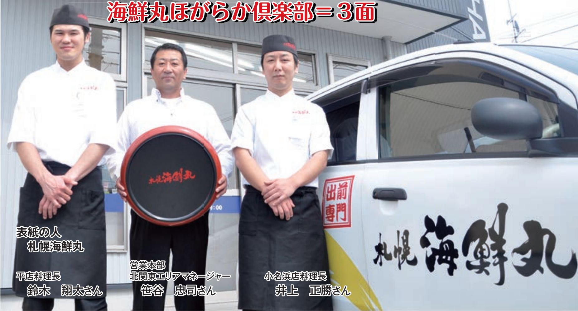
表紙の人 札幌海鮮丸