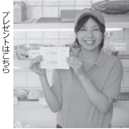
プレゼントはありがとう