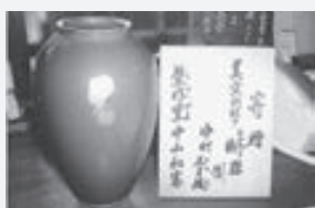
著者がひばり座へ贈った「工房紫明」の製品

不況で職場が無くなってその技が途絶えるかもしれない職種が気かりです。しかし一方では、視野を転じて伝統の成果を万年筆の軸や万華鏡の胴体を飾る方法に、腕時計の文字盤、そして新進の西洋料理人に提供する器などに開花させた業種の二エースも伝えられました。不幸にして、散らばっていった人々に一条でも光が届きますように。