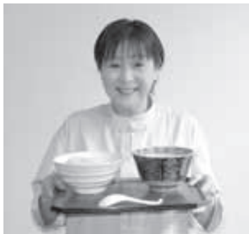
プレゼントはいろいろ

①パズルの答え ②ゴールデンウィーク... 応募はがきに... 8 春の山菜の代表格、食べ方はてんぷらにするのが代表的で、と、住所、氏名、年齢、