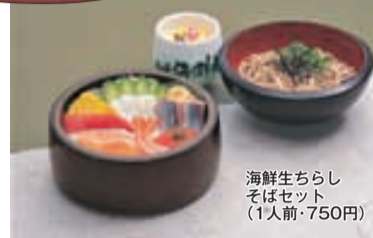
海鮮生らし そはセット (1人前・750円)