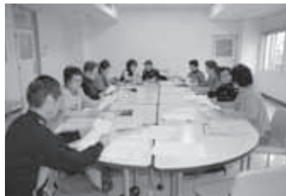
例会では積極的に意見を交わす

「朗読会に来て くれた人が『帰りに図 書館で本を借ります』 って言ってくれたとき は本当にうれしかった 動が声の使者 たちの活力だ。