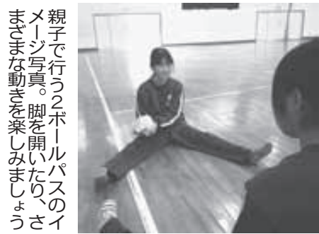
親子で行う2ボールパスのイメージ写真。脚を開いたり、さまざまな動きを楽しみましょう

屋内でのトレーニング 親が触った場所を子供がマネする。2カ所触ったり、左右の手で別の場所を触ると一層効果的。 ②ボールパス: 親子でボールを1つずつ持ち、ぶつからないように2つ同時に投げて交換。脚を開いて左右のひざの前で行った、左右交互に動きながら行った