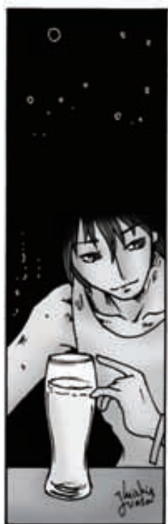
イラスト/湯浅瑞樹 http://www.mizdesk.com

1969年3月12日生まれ。プロボディーボーダー&EMOTIONプロデューサー。スポンサー:マント、オニール、ペンサーフショップ。ボディーボードの普及と音楽&アートをMIXさせたスタイルで独自の活動を展開。 HP http://www.15.ocn.ne.jp/~emotion/