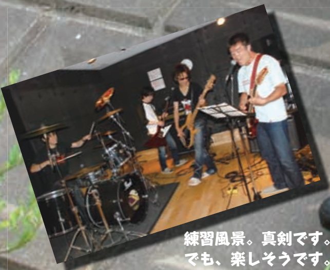
練習風景。真剣です。 でも、楽しそうです。