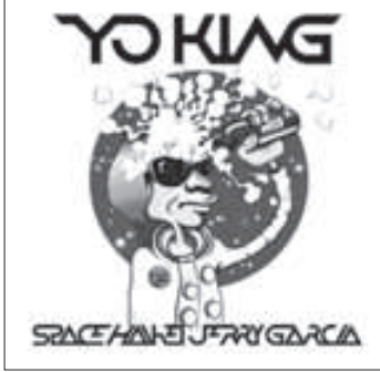
「スペース〜拝啓、ジェリーガルシア〜」 YO-KING (2010年7月発売)

どんなに強くシャウトしても物悲しく聴こえるそんな声が好き。オーティスレディングや忌野清志郎のような声。シンプルな歌詞もそんな声で歌われたらグッとときちやうな。そんな声で歌われるラブソングがたまらなく好き。