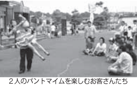
2人のパントマイムを楽しむお客さんたち