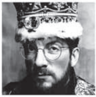
「King of America」 エルビスコストロ (1986年発売)

トリスアルブムは、生きた最新発売を溢れ行くニヤニヤと強いの声でやさしく歌っている一枚! 素直が楽しだよと教える